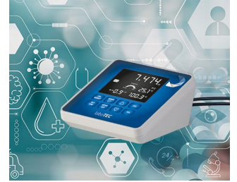
Laboratory measuring device