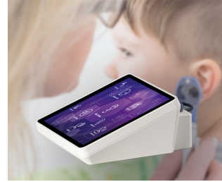
Hearing test device