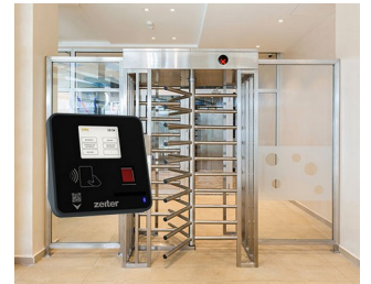
Terminal for access control