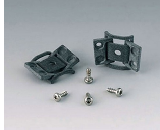
C8100360 Internal hinge set