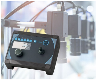
Camera control in production

注定用于室内和受保护的室外区域的高质电气和电子应用范围。机械制造和设备建设工程。供暖、空调和通风技术领域。IoT/IIoT 物联网/工业物联网。智能工厂/工业 4.0。网关控制器。数据记录器。信息和通信技术领域 (ICT)。电气安装领域。检测和调控技术领域。农业、农场建设。传感器技术。保安技术。