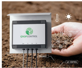
Smart Farming - system for long-term measurements