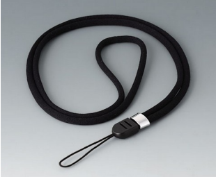
B9100063 Carrying strap, textile lanyard black 860mm