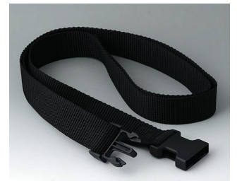
B7110149 Belt strap