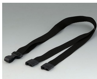
B9100073 Carrying strap, textile lanyard