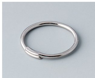
A9164001 Key ring Steel nickel-plated 20.5mm