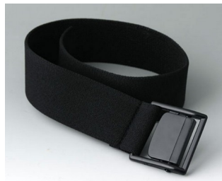
B7110129 Belt strap