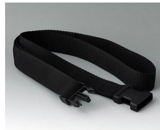
B7110139 Belt strap