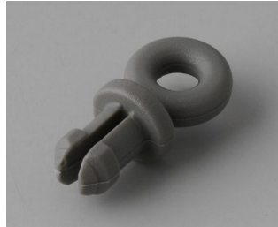
A910002 Ring eyelet PA 6 volcano