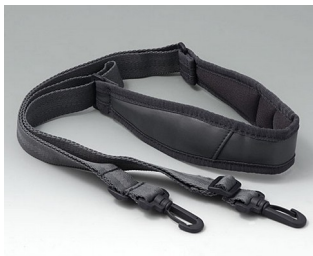
B4308650 Shoulder strap