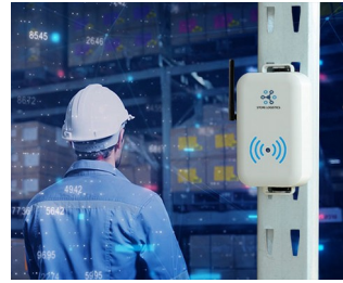
Smart store logistics