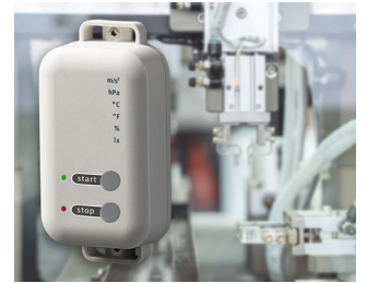
Data logger with gateway function