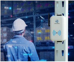
Smart store logistics