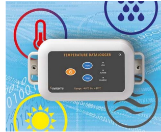
Data logger e.g. for temperature