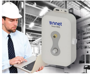
Sensor box for process monitoring