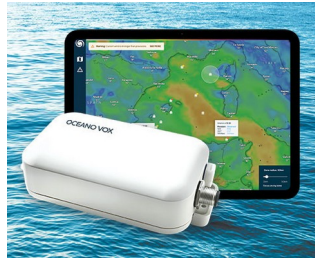
Data Collection for Ocean Observation network