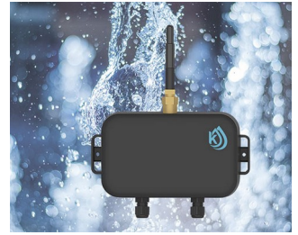
Water level monitoring