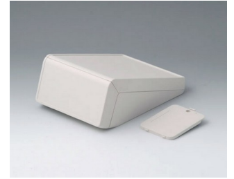
B4054237 UNITEC S, 0.6/1.4 ABS (UL 94 HB) off-white RAL 9002 125x177x69mm IP 40