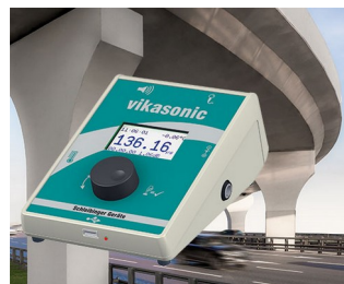
Ultrasonic measuring device