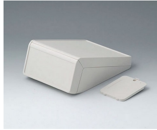
B4054217 UNITEC S, 1.4/1.4 ABS (UL 94 HB) off-white RAL 9002 125x177x69mm IP 40