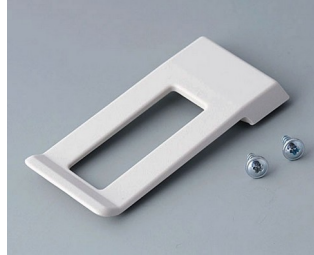
A9172107 Belt/Pocket clip ABS (UL 94 HB) off-white RAL 9002 62x30mm