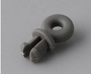
A9100001 Ring eyelet PA 6 volcano