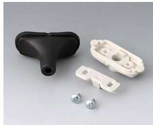
B2911319 Cable gland kit, 4.2 - 5.0 TPE black RAL 9005