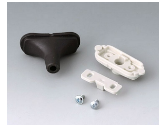
B2911329 Cable gland kit, 5.0 - 5.9 TPE black RAL 9005