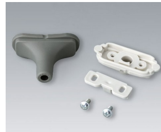
B2911328 Cable gland kit, 5.0 - 5.9 TPE volcano