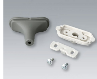
B2911308 Cable gland kit, 3.4 - 4.2 TPE volcano