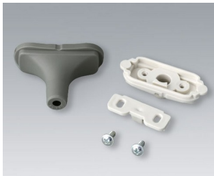
B2911318 Cable gland kit, 4.2 - 5.0 TPE volcano