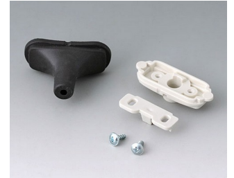
B2911309 Cable gland kit, 3.4 - 4.2 TPE black RAL 9005