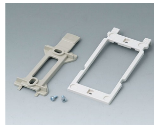
B1350048 Набор для настенного монтажа АБС (UL 94 HB) тепло-серый RAL 7032