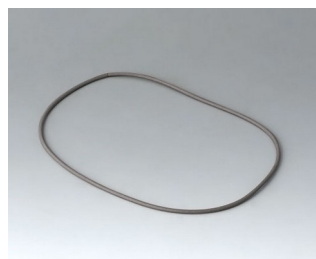
A9503030 Уплотнительная прокладка 125