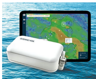
Data Collection for Ocean Observation network