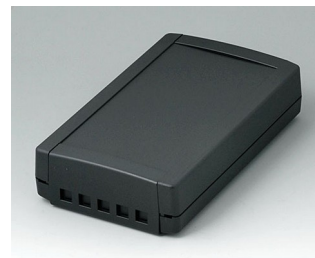
B1075469 TOPTEC 194 F, исп. II АБС (UL 94 HB) черный RAL 9005 194x115x46mm IP 40