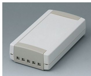
B1065465 TOPTEC 154 F, исп. II АБС (UL 94 HB) белый RAL 9002 154x84x38mm IP 40