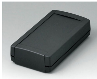
B1065369 TOPTEC 154 F, исп. I АБС (UL 94 HB) черный RAL 9005 154x84x38mm IP 40