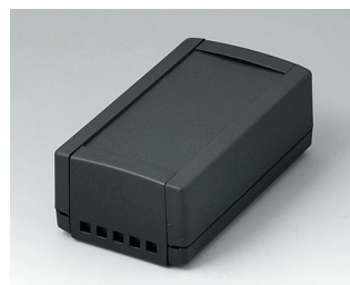
B1050469 TOPTEC 123 H, исп. II АБС (UL 94 HB) черный RAL 9005 123x68x45mm IP 40