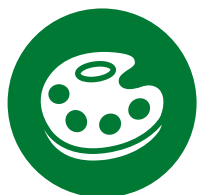
Отливка из нестандартных материалов