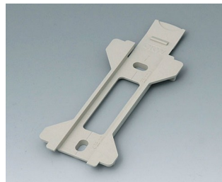
B1360028 Настенный держатель для TOPTEC 154 ПК+АБС (UL 94 V-0) тепло-серый RAL 7032