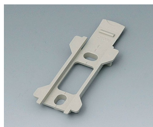
B1340028 Настенный держатель для TOPTEC 102 ПК+АБС (UL 94 V-0) тепло-серый RAL 7032