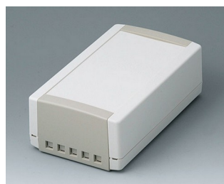
B1070465 TOPTEC 194 H, исп. II АБС (UL 94 HB) белый RAL 9002 194x115x68mm IP 40