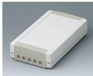
B1075465 TOPTEC 194 F, исп. II АБС (UL 94 HB) белый RAL 9002 194x115x46mm IP 40