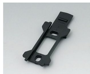
B1340029 Настенный держатель для TOPTEC 102 АБС (UL 94 HB) черный RAL 9005