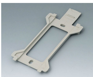
B1370028 Настенный держатель для TOPTEC 194 ПК+АБС (UL 94 V-0) тепло-серый RAL 7032