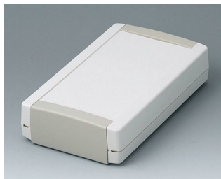
B1075365 TOPTEC 194 F, исп. I АБС (UL 94 HB) белый RAL 9002 194x115x46mm IP 40