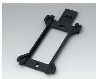
B1370029 Настенный держатель для TOPTEC 194 АБС (UL 94 HB) черный RAL 9005