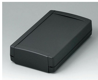
B1075369 TOPTEC 194 F, исп. I АБС (UL 94 HB) черный RAL 9005 194x115x46mm IP 40