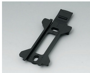
B1350029 Настенный держатель для TOPTEC 123 АБС (UL 94 HB) черный RAL 9005