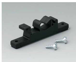
B1300019 Адаптер для монтажа на DIN-рейку ПА 6 черный RAL 9005