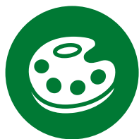
Отливка из нестандартных материалов