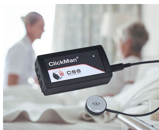
Adaptive multicontroller for single sensors

Универсальные корпуса для электронных и электротехнических приборов. Мониторинг, системы оповещения и управления. Медицинская и оздоровительная техника. Лабораторные приборы. Компьютерная периферия. IoT/IIoT.