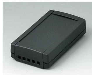
B1055469 TOPTEC 123 F, исп. II АБС (UL 94 HB) черный RAL 9005 123x68x30mm IP 40