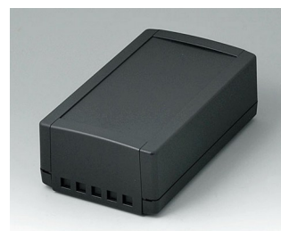
B1070469 TOPTEC 194 H, исп. II АБС (UL 94 HB) черный RAL 9005 194x115x68mm IP 40