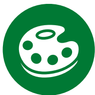
Отливка из нестандартных материалов