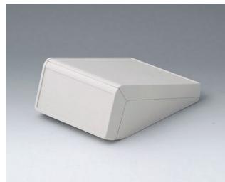
B4054127 UNITEC S, 1,4/0,6 АБС (UL 94 HB) белый RAL 9002 125x177x69mm IP 40