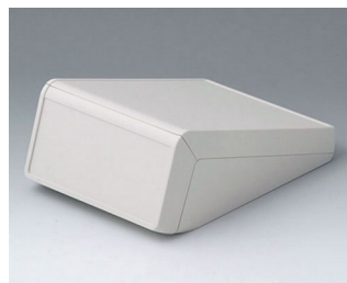
B4056127 UNITEC M, 1,4/0,6 АБС (UL 94 HB) белый RAL 9002 148x210x80mm IP 40