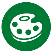
Отливка из нестандартных материалов