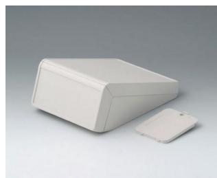
B4054227 UNITEC S, 1,4/0,6 АБС (UL 94 HB) белый RAL 9002 125x177x69mm IP 40