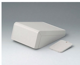
B4054207 UNITEC S, 0,6/0,6 АБС (UL 94 HB) белый RAL 9002 125x177x69mm IP 40