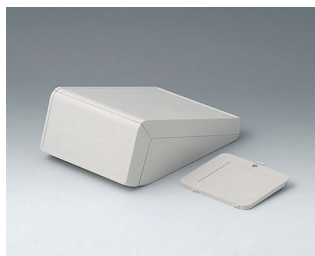
B4054307 UNITEC S, 0,6/0,6 АБС (UL 94 HB) белый RAL 9002 125x177x69mm IP 40