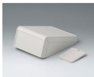
B4054227 UNITEC S, 1,4/0,6 АБС (UL 94 HB) белый RAL 9002 125x177x69mm IP 40