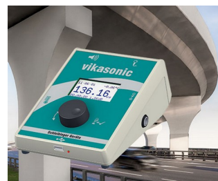
Ultrasonic measuring device