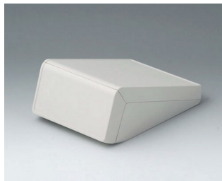
B4054107 UNITEC S, 0,6/0,6 АБС (UL 94 HB) белый RAL 9002 125x177x69mm IP 40