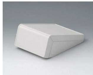
B4054137 UNITEC S, 0,6/1,4 АБС (UL 94 HB) белый RAL 9002 125x177x69mm IP 40