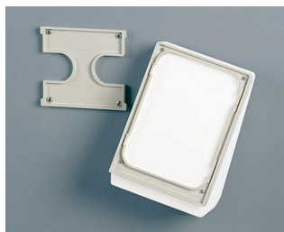
B4154307 Набор для настенного монтажа S белый RAL 9002