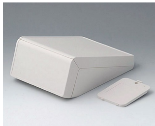
B4056207 UNITEC M, 0,6/0,6 АБС (UL 94 HB) белый RAL 9002 148x210x80mm IP 40