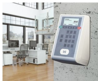
Time recording terminal