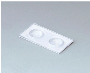
A9207150 Резиновые ножки 6,5 x 2 мм прозрачный