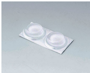
A9212330 Резиновые ножки 12 x 3,5 мм прозрачный

Возможно внесение изменений без предварительного уведомления. © by OKW Gehäusesysteme, Buchen/Germany.