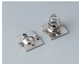
A9190015 Набор батарейных контактов, 2 x AA Сталь никелированный