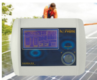
Control unit for photovoltaic solar installations

Периферийное оборудование для компьютеров. IoT/IIoT. Схемотехника. Терминалы сбора данных. Охранные системы и контроль доступа. Контрольно-измерительная аппаратура. Медицинская и оздоровительная техника, лабораторное оборудование.