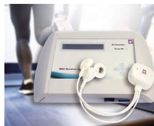
WBA receiver unit for measuring biosignals