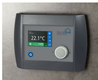
Solar Control Panel