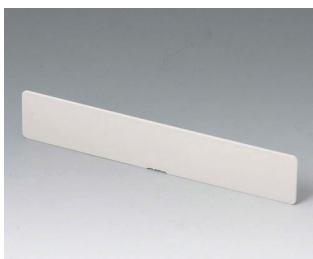
A9194007 Перегородка АБС (UL 94 HB) белый RAL 9002 156x30x3mm