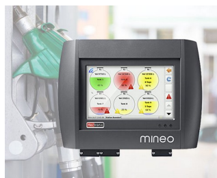
Controller for intelligent tank management