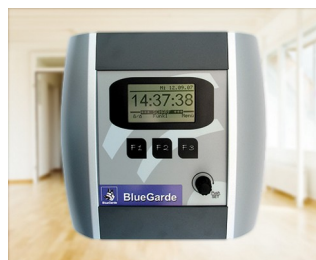
House control unit