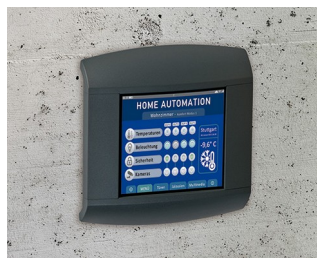
Пульт управления для "умного дома"