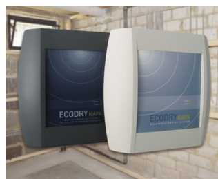
Systems for drying brickwork