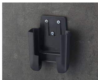
A9105628 Настенный держатель S АСА+ПК (UL 94 V-0) лава