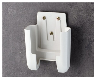
A9106627 Настенный держатель M АСА+ПК (UL 94 V-0) белый RAL 9002