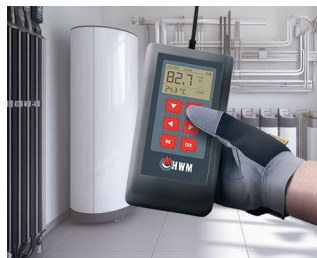
Measuring device for heating water