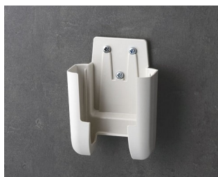
A9105627 Настенный держатель S АСА+ПК (UL 94 V-0) белый RAL 9002