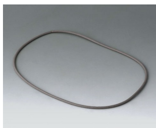
B4514030 Sealing 140