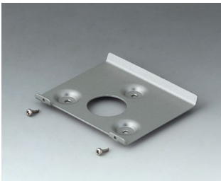
B4514101 Wall suspension element 140 Aluminium