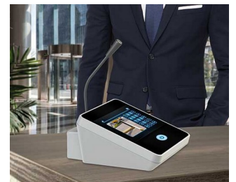
Table microphone / inter phone