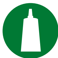
Instalação / Montagem de acessórios