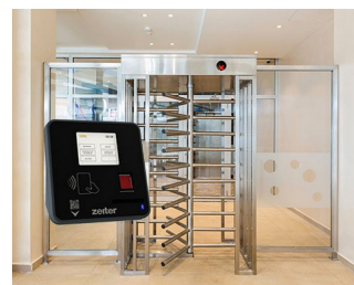
Terminal for access control