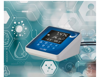
Laboratory measuring device