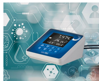
Laboratory measuring device