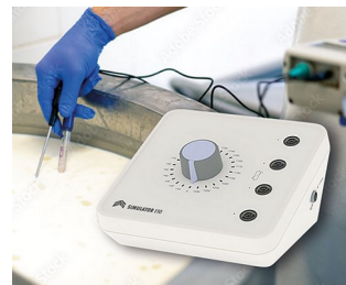
Simulator for testing measuring instruments