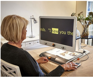
Control knobs for video magnifier

Para potenciômetros rotativos com pontas de eixos correspondente a DIN 41591 ou com extremidades achatadas \varnothing 6/4,6 mm. Medição e controle da tecnologia, médica e dispositivos de bem-estar, equipamento de laboratório, aquecimento e ar condicionado, equipamentos de comunicação, gestão de edifício, etc.