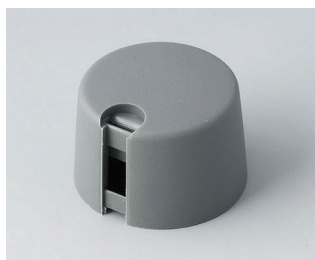
A1024648 TOP-KNOBS 24 PA 6 volcano 24x16mm