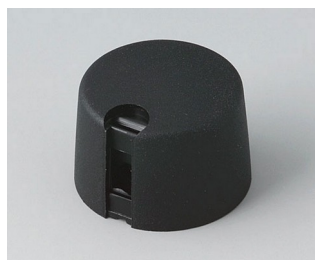
A1024649 TOP-KNOBS 24 PA 6 nero 24x16mm