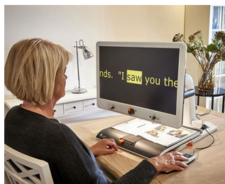
Control knobs for video magnifier

Para potenciômetros rotativos com pontas de eixos correspondente a DIN 41591 ou com extremidades achatadas \varnothing 6/4,6 mm. Medição e controle da tecnologia, médica e dispositivos de bem-estar, equipamento de laboratório, aquecimento e ar condicionado, equipamentos de comunicação, gestão de edifício, etc.