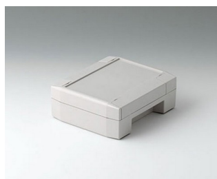
C8011132 SOLID-BOX 115 PC+ABS (UL 94 V-0) light grey RAL 7035 135x115x50mm IP 66, IP 67, IK 08