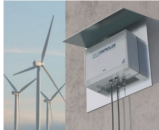
Controller wind turbines