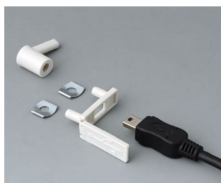
A9320207 USB cover, type Mini-USB PP off-white RAL 9002 29,5x8,5mm

Sujeito à modificações técnicas sem aviso prévio. © de OKW Gehäusesysteme, Buchen/Alemanha.