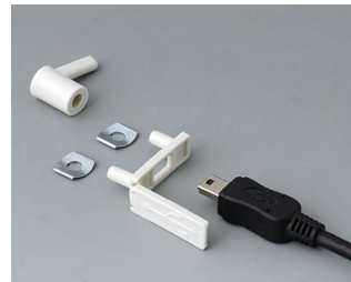
A9320207 USB cover, type Mini-USB PP off-white RAL 9002 29,5x8,5mm

Sujeito à modificações técnicas sem aviso prévio. © de OKW Gehäusesysteme, Buchen/Alemanha.