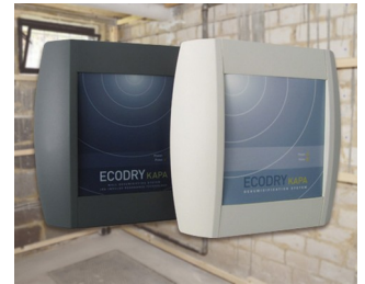
Systems for drying brickwork