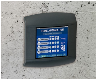
Control panel for home automation

Equipamentos periféricos para computadores, IoT/IloT, engenharia de sistemas de dados, sistemas de coleta de dados, controles de acesso e de segurança, medição, controle de dispositivos, médica, conforto, bem-estar e tecnologia de laboratório, etc.