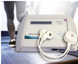
WBA receiver unit for measuring biosignals