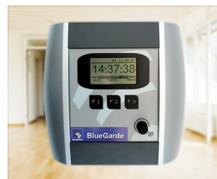
House control unit