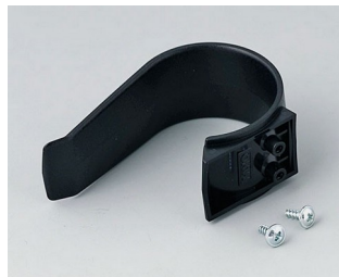
A9167029 Holding clamp PA 6 (UL 94 HB) black RAL 9005