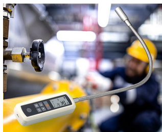
Gas leak detector

Sistemas de engenharia de dados, tecnologia de rede, sistemas de serviços de construção, engenharia de segurança, IoT/ IIoT, aplicações médicas e terapêuticas, instrumentos de análise em laboratório, técnica de medição, nomeadamente detectores com sonda de medição, sistemas/instrumentos de teste, registrador de dados na tecnologia ambiental, sistema de sensores, etc.