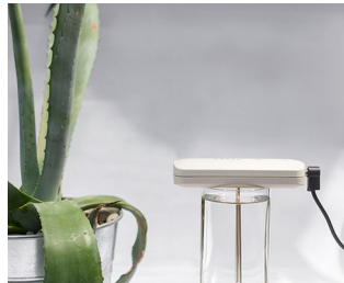
Tool for making colloidal silver solutions