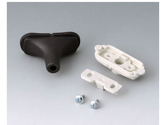
B2911329 Cable gland kit, 5.0 - 5.9 TPE black RAL 9005