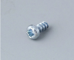
A0304031 Self-tapping screws 2.2 x 5 mm (PZ1)

Sujeito à modificações técnicas sem aviso prévio. © de OKW Gehäusesysteme, Buchen/Alemanha.