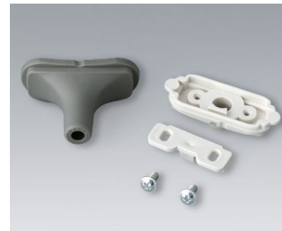
B2911328 Cable gland kit, 5.0 - 5.9 TPE volcano