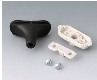
B2911319 Cable gland kit, 4.2 - 5.0 TPE black RAL 9005