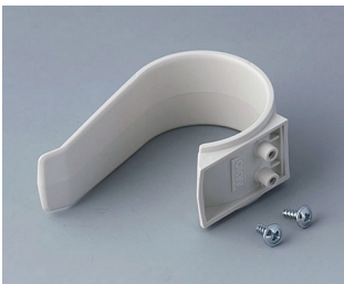
A9167027 Holding clamp PA 6 (UL 94 HB) off-white RAL 9002