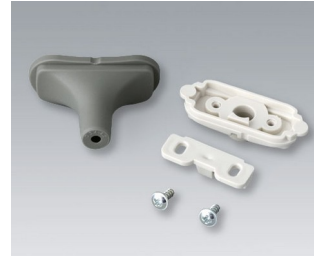
B2911308 Cable gland kit, 3.4 - 4.2 TPE volcano