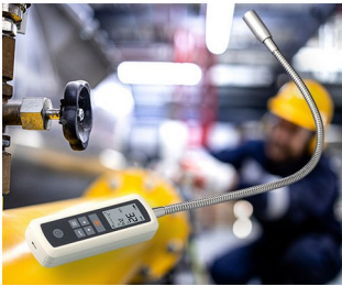
Gas leak detector

Sistemas de engenharia de dados, tecnologia de rede, sistemas de serviços de construção, engenharia de segurança, IoT/ IIoT, aplicações médicas e terapêuticas, instrumentos de análise em laboratório, técnica de medição, nomeadamente detectores com sonda de medição, sistemas/instrumentos de teste, registrador de dados na tecnologia ambiental, sistema de sensores, etc.