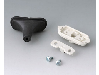
B2911309 Cable gland kit, 3.4 - 4.2 TPE black RAL 9005