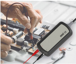
Test Probe Interface for PC Applications