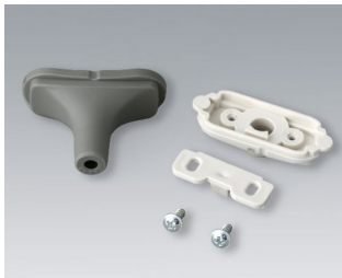
B2911318 Cable gland kit, 4.2 - 5.0 TPE volcano