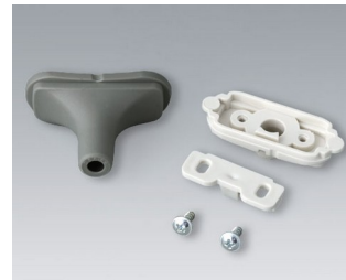
B2911328 Cable gland kit, 5.0 - 5.9 TPE volcano