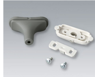
B2911308 Cable gland kit, 3.4 - 4.2 TPE volcano