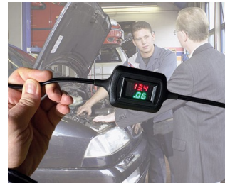
Voltage and current display during trickle charging