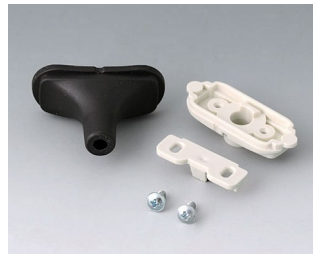
B2911319 Cable gland kit, 4.2 - 5.0 TPE black RAL 9005