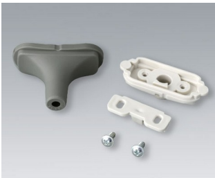
B2911318 Cable gland kit, 4.2 - 5.0 TPE volcano