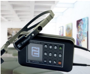
Multimedia audioguide for museums