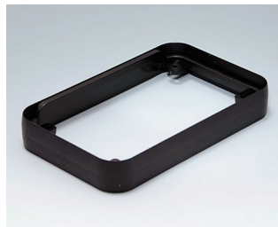
A9152129 Intermediate ring M PMMA (IR) (UL 94 HB) black RAL 9005 68x108x16mm