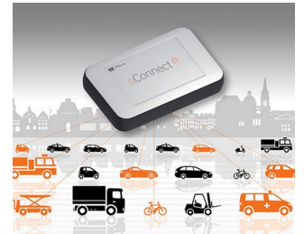
Module for smart mobility applications