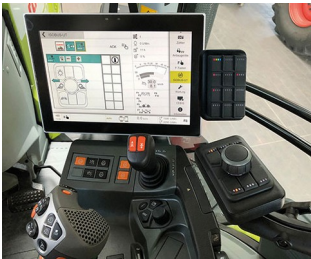
Digital joystick for ISO bus machines

Todos os tipos de dispositivos de controle remoto, sem fio ou com cabo, medição e engenharia de controle, tecnologia de controle digital, médica e laboratório de tecnologia, periféricos e equipamentos de interface, tecnologia de comunicações, IoT/IloT, etc.