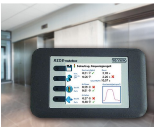
RIDEwatcher Multimeter for ride profiles