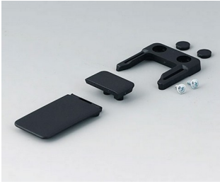
A9152049 Combi-Clip ABS (UL 94 HB) black RAL 9005 45x27mm