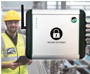
Industrial Secure Gateway

Dispositivos periféricos e de interface, office, técnica de comunicação, técnica de segurança, biometria, engenharia médica e tecnologia de laboratório, health care, automação, smart factory, industrie 4.0, tecnologia de medição, regulação e comando, etc.