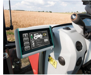
ISOBUS terminal for tractors and self-propelled machines