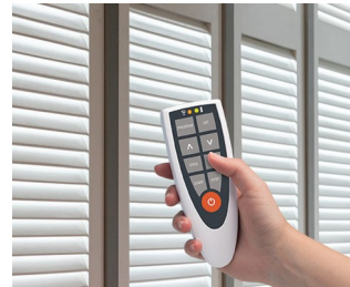
Remote control for room climate