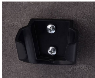
B2903039 Holder M ASA (UL 94 HB) black RAL 9005