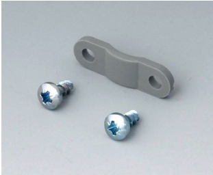
A9199005 Strain relief PA 6 volcano