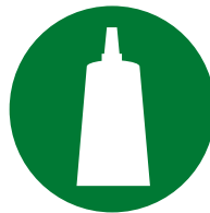
Instalação / Montagem de acessórios