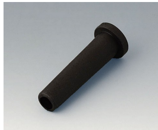
C2353849 Flexible cable grommet Ø 5,3 black