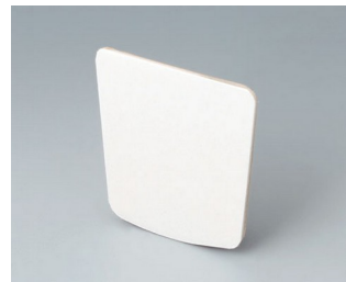
B2904031 Adhesive foil L