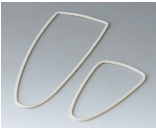
B2904111 Sealing kit L TPV 50A