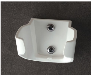
B2903037 Holder M ASA (UL 94 HB) traffic white RAL 9016