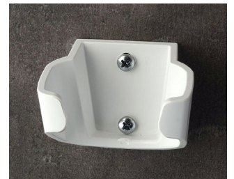
B2904037 Holder L ASA (UL 94 HB) traffic white RAL 9016