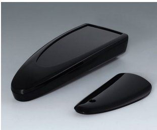
B2804016 STYLE-CASE L PMMA (IR) (UL 94 HB) black RAL 9005 166x64x31mm IP 65 opt., IP 40