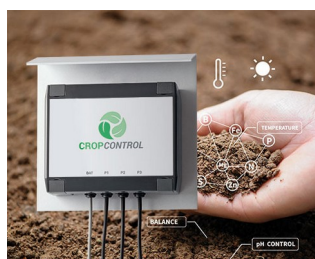
Smart Farming - system for long-term measurements