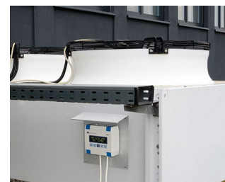
Heating/air conditioning/ventilation control