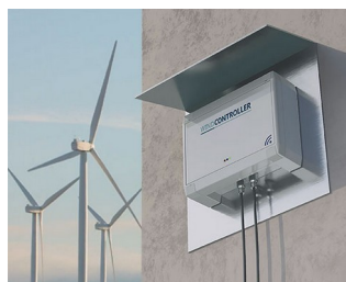
Controller wind turbines