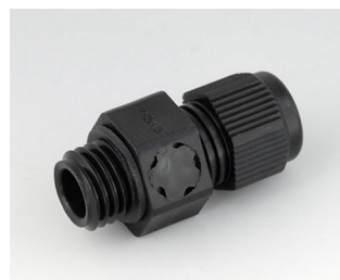
C2312919 Cable gland M12x1.5, pressure compensation PA 6 (UL 94 V-0) black RAL 9005