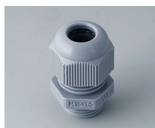
C2316418 Cable gland M16x1.5 PA 6 silver grey RAL 7001