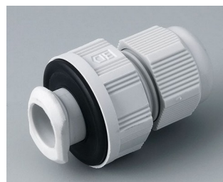
C2316717 Quick fix cable gland, M16 PA 6 light grey RAL 7035