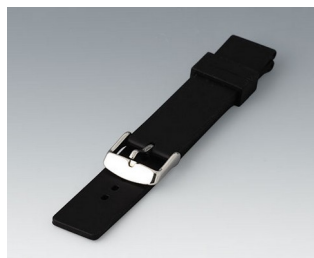
B1706202 Wrist strap, 18 mm Silicone black