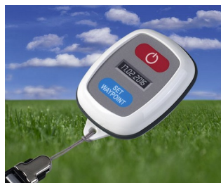
GPS tracking system