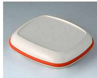
B1608207 BODY-CASE XL, with recess ASA (UL 94 HB) traffic white RAL 9016 62x56x17mm IP 65