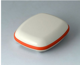
B1604107 BODY-CASE M, without recess ASA (UL 94 HB) traffic white RAL 9016 50x41x15mm IP 65