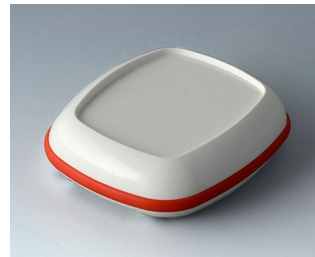
B1606207 BODY-CASE L, with recess ASA (UL 94 HB) traffic white RAL 9016 55x46x16mm IP 65