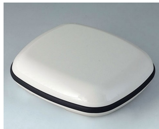
B1608117 BODY-CASE XL, without recess ASA (UL 94 HB) traffic white RAL 9016 62x56x18mm IP 65