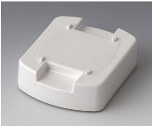
B1704017 Station M ASA (UL 94 HB) traffic white RAL 9016 62x50x17mm