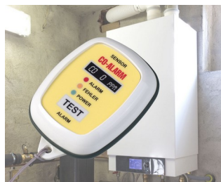
CO gas alert