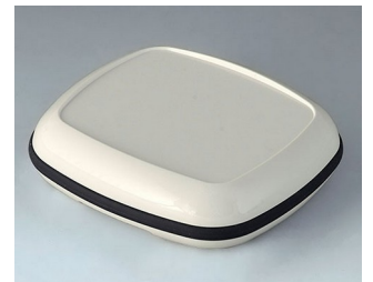
B1608217 BODY-CASE XL, with recess ASA (UL 94 HB) traffic white RAL 9016 62x56x17mm IP 65