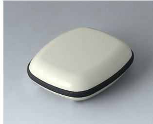
B1604117 BODY-CASE M, without recess ASA (UL 94 HB) traffic white RAL 9016 50x41x15mm IP 65