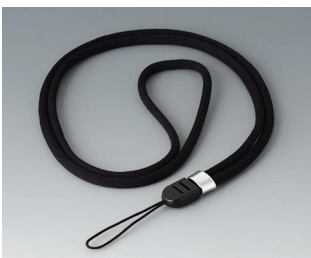
B9100063 Carrying strap, textile lanyard black 860mm