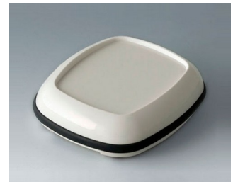
B1606217 BODY-CASE L, with recess ASA (UL 94 HB) traffic white RAL 9016 55x46x16mm IP 65