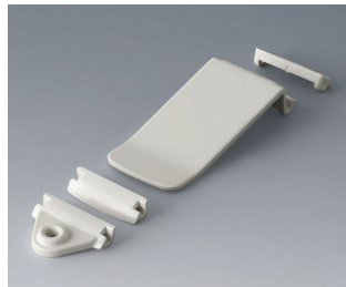
B1706001 Eyelet / pocket clip kit ASA (UL 94 HB) traffic white RAL 9016