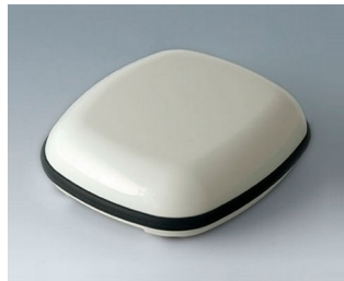
B1606117 BODY-CASE L, without recess ASA (UL 94 HB) traffic white RAL 9016 55x46x17mm IP 65