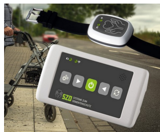
Dementia Protection System