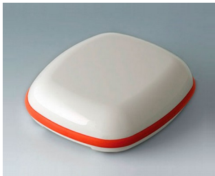
B1606107 BODY-CASE L, without recess ASA (UL 94 HB) traffic white RAL 9016 55x46x17mm IP 65