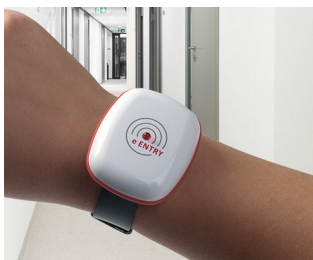
eEntry access and security controls