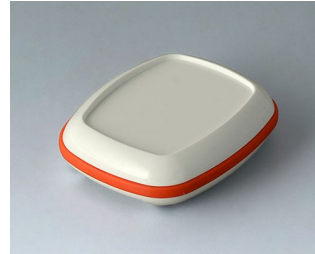
B1604207 BODY-CASE M, with recess ASA (UL 94 HB) traffic white RAL 9016 50x41x14mm IP 65