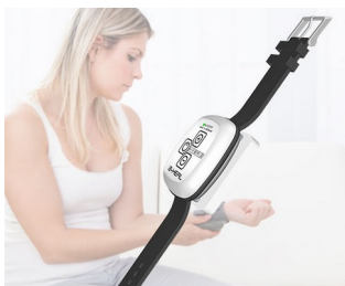
B-heal Hybrid Blood Zapper

Bezprzewodowe urządzenie zapisujące z transmisją danych, śledzenie i monitorowanie, wywołanie alarmowe oraz systemy powiadamiania, a także czujniki bio do monitorowania stanu zdrowia, technologie medyczne, terapeutycznych i społecznych dziedzinach. Wearables, IoT/ IIoT, systemy połączeń alarmowych i powiadomień, sprzęt do śledzenia i monitorowania, czujniki bio-sprzężenia zwrotnego w dziedzinie opieki zdrowotnej, technologii medycznej, w dziedzinach terapeutycznych i społecznych, wypoczynek i sport, technologii komunikacji, sprzedaży akcji i rejestrowania, inżynierii bezpieczeństwa, techniki sterowania i automatyzacji, praca, gdzie wymagana jest lokalizacja.