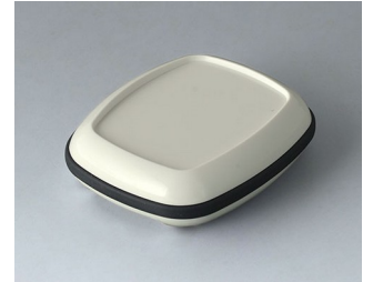
B1604217 BODY-CASE M, with recess ASA (UL 94 HB) traffic white RAL 9016 50x41x14mm IP 65