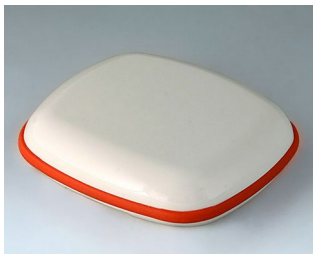
B1608107 BODY-CASE XL, without recess ASA (UL 94 HB) traffic white RAL 9016 62x56x18mm IP 65