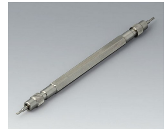
B1706203 Spring bar tool Stainless steel