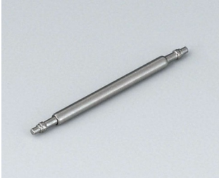
B1706206 Spring bar, Ø 1.5 x 19 mm Stainless steel