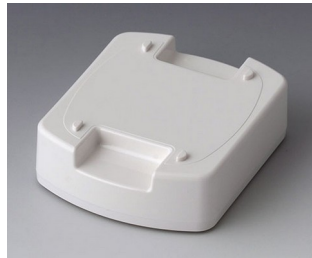
B1706017 Station L ASA (UL 94 HB) traffic white RAL 9016 62x50x17mm