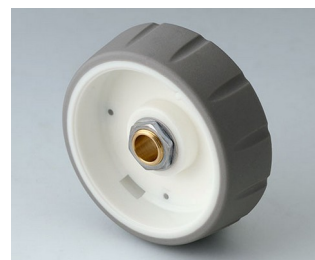
B7146064 CONTROL-KNOBS 46 PC volcano 46x14,7mm 6mm