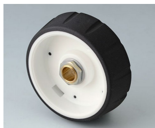
B7146062 CONTROL-KNOBS 46 PC nero 46x14,7mm 6mm