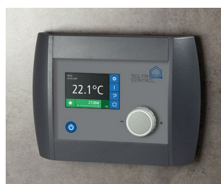
Solar Control Panel