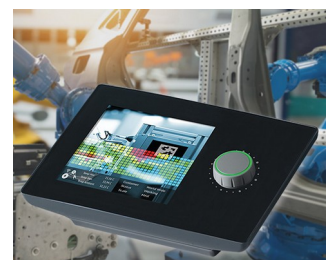
Measured value display device