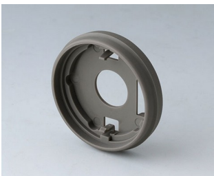
B7536208 Base 36 PA 6 volcano