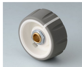
B7236064 CONTROL-KNOBS 36 PC volcano 36x14,7mm 6mm