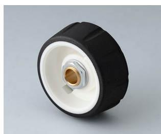
B7136062 CONTROL-KNOBS 36 PC nero 36x14,7mm 6mm