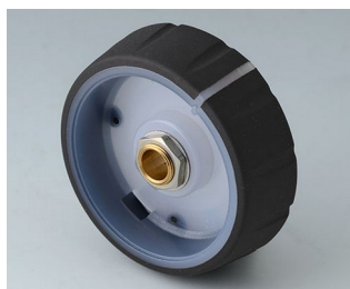
B7246061 CONTROL-KNOBS 46, optional illumination PC nero 46x14,7mm 6mm