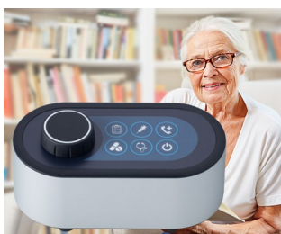
Assistance system for the home

Do stosowania z potencjometrami obrotowymi lub enkoderami impulsowymi o wałkach zgodnych z normą DIN 41591, również z tymi, które posiadają funkcję One Touch. Technologie pomiarowe i kontrolne, technologie medyczne i laboratoryjne, wellness, służba zdrowia, ogrzewanie i klimatyzacja, urządzenia komunikacyjne, zarządzanie konstrukcjami, smart factory, itp.