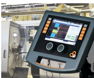
Operating elements for machine control