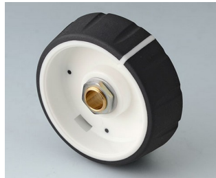
B7246062 CONTROL-KNOBS 46 PC nero 46x14,7mm 6mm