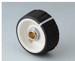
B7236062 CONTROL-KNOBS 36 PC nero 36x14,7mm 6mm