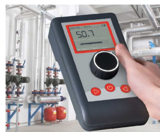
Find compressed air leaks using ultrasound