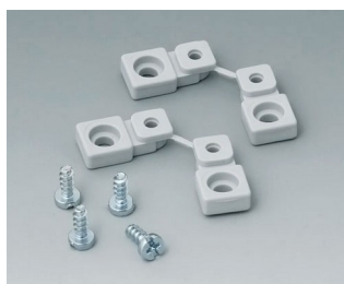
C2299028 Wall mounting brackets PA 6 (UL 94 HB) light grey RAL 7035