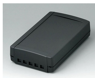
B1075469 TOPTec 194 F, Vers. II ABS (UL 94 HB) black RAL 9005 194x115x46mm IP 40