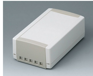
B1070465 TOPTec 194 H, Vers. II ABS (UL 94 HB) off-white RAL 9002 194x115x68mm IP 40