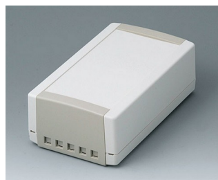
B1070465 TOPTec 194 H, Vers. II ABS (UL 94 HB) off-white RAL 9002 194x115x68mm IP 40