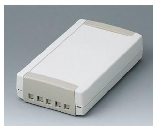
B1075465 TOPTec 194 F, Vers. II ABS (UL 94 HB) off-white RAL 9002 194x115x46mm IP 40