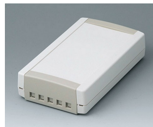
B1075465 TOPTec 194 F, Vers. II ABS (UL 94 HB) off-white RAL 9002 194x115x46mm IP 40