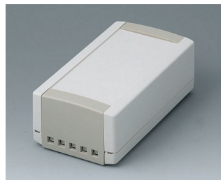
B1060465 TOPTEC 154 H, Vers. II ABS (UL 94 HB) off-white RAL 9002 154x84x56mm IP 40