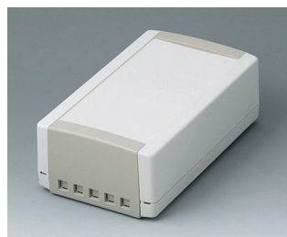
B1070465 TOPTec 194 H, Vers. II ABS (UL 94 HB) off-white RAL 9002 194x115x68mm IP 40