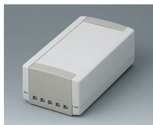
B1060465 TOPTEC 154 H, Vers. II ABS (UL 94 HB) off-white RAL 9002 154x84x56mm IP 40