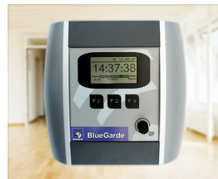
House control unit