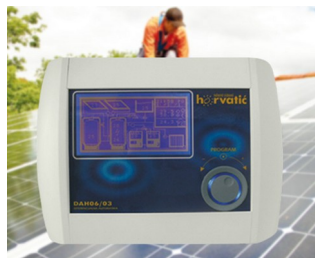
Control unit for photovoltaic solar installations