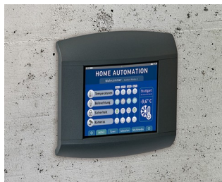
Control panel for home automation

Urządzenia peryferijnych do komputerów, IoT/IloT, systemów danych, systemy gromadzenia danych w pracy, kontrola dostępu i zabezpieczeń, urządzenia pomiarowe i sterowania, medyczne i laboratoryjne technologie, itp.