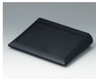
A0620009 COMTEC 200 F, Vers. I ABS (UL 94 HB) black RAL 9005 200x150x42,8mm IP 40