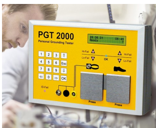
System for preventing electrostatic charges