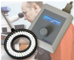
Controller for LED lighting in image processing and microscopy

Terminale do pobierania danych, urządzenia komunikacyjne, kontrola dostępu, bezpieczeństwo, medyczne, laboratoryjne, opieka zdrowotna, systemy sprzedaży, pomiar i sterowanie, rozporządzenie przemysłowe, itp.