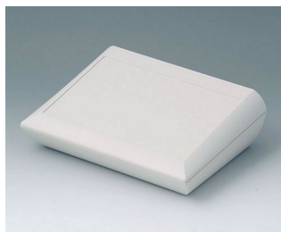
A0620107 COMTEC 200 H, Vers. I ABS (UL 94 HB) off-white RAL 9002 200x150x62,8mm IP 40