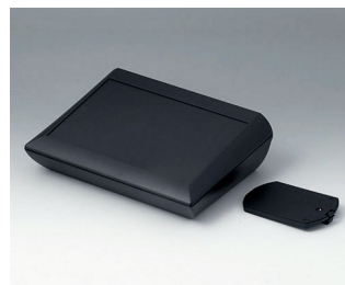
A0620119 COMTEC 200 H, Vers. II ABS (UL 94 HB) black RAL 9005 200x150x62,8mm IP 40