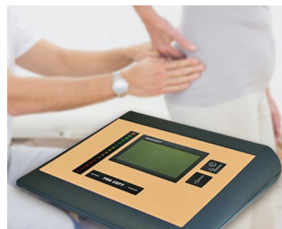
EMG bio-feedback for incontinence diagnostics and therapy