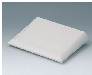
A0620007 COMTEC 200 F, Vers. I ABS (UL 94 HB) off-white RAL 9002 200x150x42,8mm IP 40