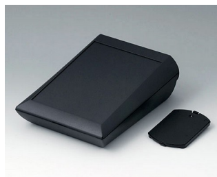
A0615119 COMTEC 150 H, Vers. II ABS (UL 94 HB) black RAL 9005 150x200x71,5mm IP 40