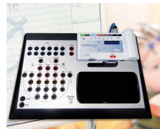
Stationary system for long-term EEG recordings