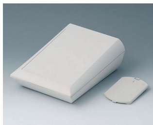
A0615117 COMTEC 150 H, Vers. II ABS (UL 94 HB) off-white RAL 9002 150x200x71,5mm IP 40