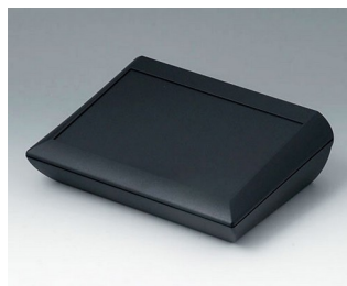
A0620109 COMTEC 200 H, Vers. I ABS (UL 94 HB) black RAL 9005 200x150x62,8mm IP 40