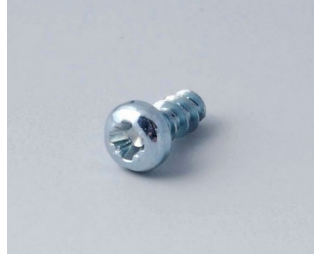
A0305031 Self-tapping screws 2.5 x 6 mm (PZ1)

Subject to technical modification without notice. © by OKW Gehäusesysteme, Buchen/Germany.