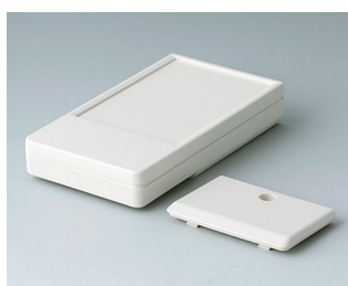
A9071117 DATEC-POCKET-BOX M ABS (UL 94 HB) off-white RAL 9002 105x58x18,5mm IP 54