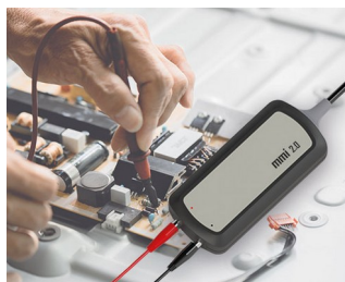
Test probe interface for PC applications