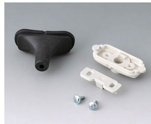
B2911309 Cable gland kit, 3.4 - 4.2 TPE black RAL 9005