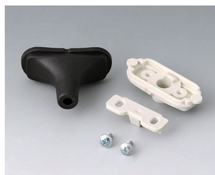
B2911319 Cable gland kit, 4.2 - 5.0 TPE black RAL 9005