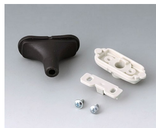
B2911329 Cable gland kit, 5.0 - 5.9 TPE black RAL 9005