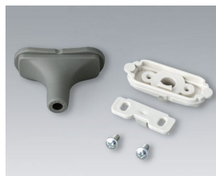
B2911328 Cable gland kit, 5.0 - 5.9 TPE volcano