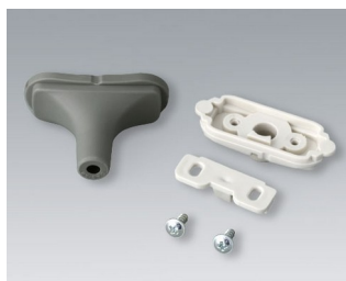
B2911318 Cable gland kit, 4.2 - 5.0 TPE volcano