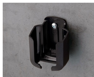
B2921509 Holder S ASA+PC (UL 94 V-0) black RAL 9005