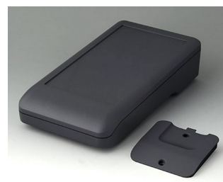
A9007218 DATEC-COMPACT L ASA+PC (UL 94 V-0) lava 206x110x47mm IP 41