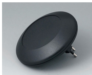
B5011229 ART-CASE R110 F PC+ABS (UL 94 V-0) black RAL 9005 ø110x38mm IP 40