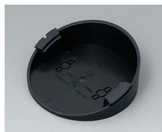
B5011219 Base 30° ABS (UL 94 HB) black RAL 9005