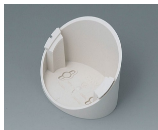
B5011317 Base 55° ABS (UL 94 HB) off-white RAL 9002