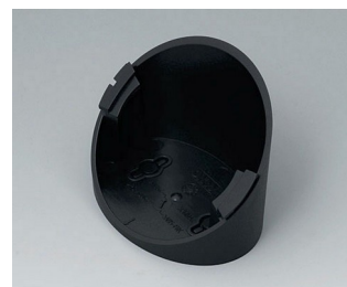
B5011319 Base 55° ABS (UL 94 HB) black RAL 9005