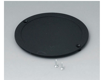
B5011849 Lid ABS (UL 94 HB) black RAL 9005