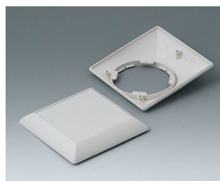
B5012207 Bottom and top part S110 F ABS (UL 94 HB) off-white RAL 9002 110x110x38mm