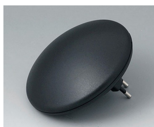
B5011329 ART-CASE R110 H PC+ABS (UL 94 V-0) black RAL 9005 ø110x41mm IP 40