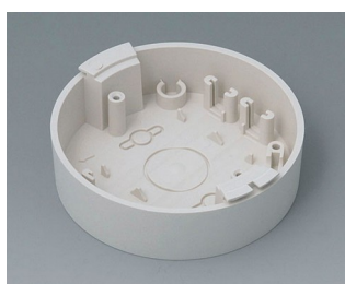
B5011117 Base ABS (UL 94 HB) off-white RAL 9002