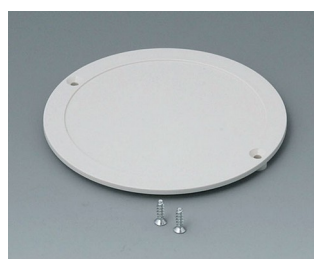
B5011847 Lid ABS (UL 94 HB) off-white RAL 9002