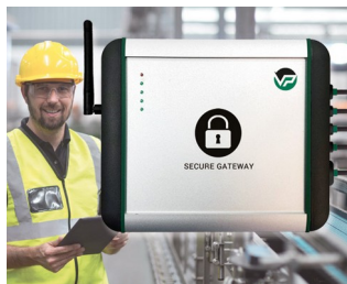
Industrial Secure Gateway

Sprzęt peryferyjny i interfejs, sprzęt biurowy, technologia komunikacyjna, inżynieria bezpieczeństwa, biometryka, technologia medyczna i laboratoryjna, służba zdrowia, automatyka, systemy pomiarów i systemy sterowania, itp.