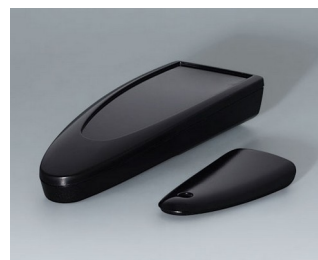
B2803016 STYLE-CASE M PMMA (IR) (UL 94 HB) black RAL 9005 147x56x27mm IP 65 opt., IP 40