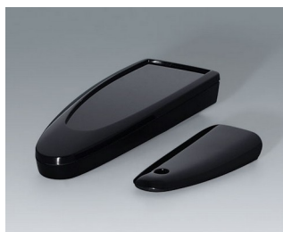
B2802016 STYLE-CASE S PMMA (IR) (UL 94 HB) black RAL 9005 123x48x24mm IP 40