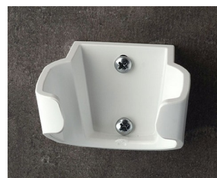
B2904037 Holder L ASA (UL 94 HB) traffic white RAL 9016