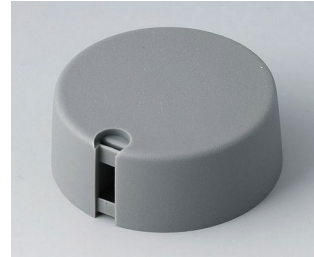
A1040048 TOP-KNOBS 40 PA 6 volcano 40x16mm 4mm