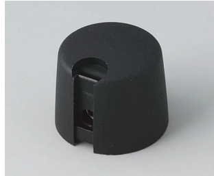
A1020649 TOP-KNOBS 20 PA 6 nero 20x16mm