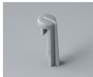
A1105007 Arrow PA 6 (UL 94 HB) mineral