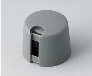
A1020648 TOP-KNOBS 20 PA 6 volcano 20x16mm