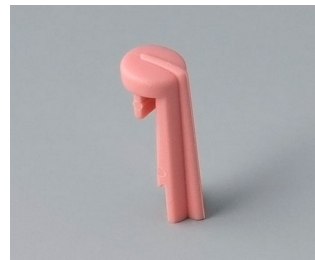
A1105003 Arrow PA 6 (UL 94 HB) coral