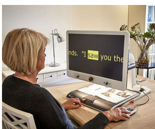
Control knobs for video magnifier

Per potenziometri rotanti con estremità arrotondate dell'albero secondo DIN 41591 o estremità appiattite \varnothing 6/4,6 mm. Metrologia e tecnica di regolazione, tecnica medica e di laboratorio, wellness, health care, tecnica di riscaldamento e di condizionamento dell'aria, comunicazione, edifici, ecc.