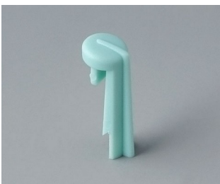
A1105005 Arrow PA 6 (UL 94 HB) lagoon