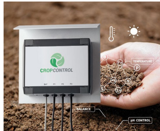
Smart Farming - system for long-term measurements