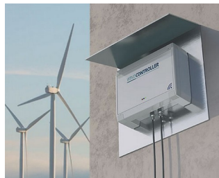
Controller wind turbines