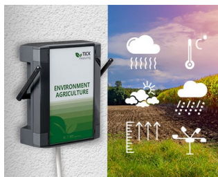
Weather station in agriculture