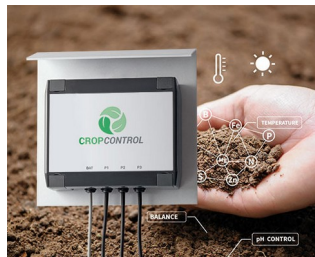
Smart Farming - system for long-term measurements