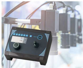
Camera control in production

Predestinato per applicazioni di altro livello in campo elettrico ed elettronico in interni e in esterni protetti per esempio ingegneria meccanica e impiantistica, tecnica di riscaldamento, condizionamento e ventilazione, IoT/IIoT, smart factory / industria 4.0, gateway, data logger, tecnologia dell'informazione e della comunicazione (TIC), installazioni elettriche, metrologia e tecnica di regolazione, agricoltura e zootecnica, sensori e tecnica di sicurezza.