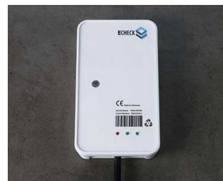
Wired device in the IIoT