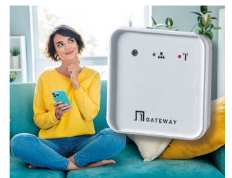
Smart home gateway