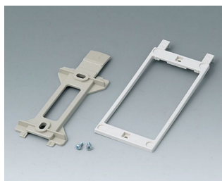
B1360048 Wall suspension elements ABS (UL 94 HB) pebble grey RAL 7032