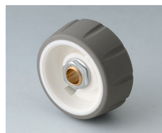
B7136634 CONTROL-KNOBS 36 PC volcano 36x14,7mm 1/4"