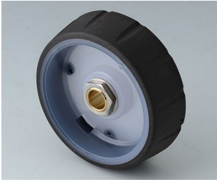
B7146061 CONTROL-KNOBS 46, optional illumination PC nero 46x14,7mm 6mm