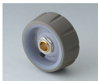
B7136633 CONTROL-KNOBS 36, optional illumination PC volcano 36x14,7mm 1/4"