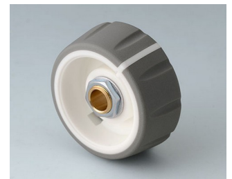
B7236064 CONTROL-KNOBS 36 PC volcano 36x14,7mm 6mm