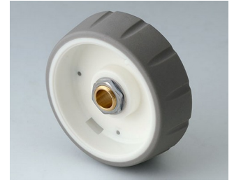
B7146064 CONTROL-KNOBS 46 PC volcano 46x14,7mm 6mm