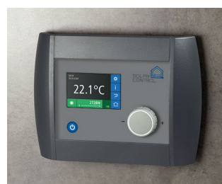
Solar Control Panel