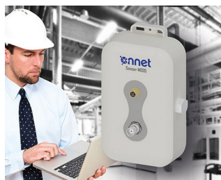
Sensor box for process monitoring