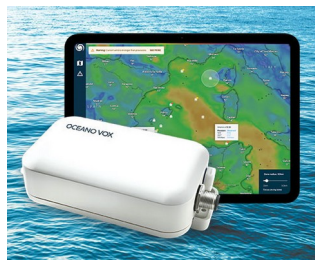
Data Collection for Ocean Observation network