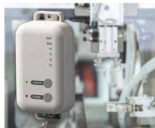
Data logger with gateway function