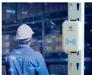
Smart store logistics