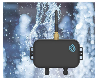
Water level monitoring