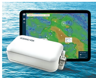
Data Collection for Ocean Observation network