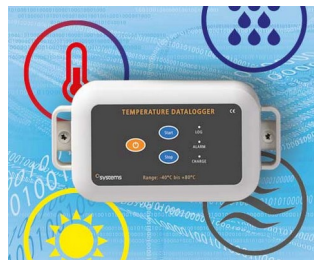
Data logger e.g. for temperature