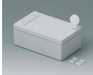
C3006101 SNAPTEC 60 x 100 ABS (UL 94 HB) light grey RAL 7035 60x100x40mm IP 65