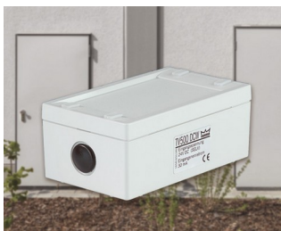
Electromechanical door locking device

Predestinati per gli impianti elettrici, ad es. nella tecnica di riscaldamento, condizionamento e ventilazione per apparecchi di controllo e di monitoraggio, nella realizzazione di sistemi di controllo e di impianti, dei sistemi di sicurezza ecc. Ma utilizzabili anche in ambito elettronico, ad es. per strumenti di misura digitali o analogici, sensori, come contenitori per interfacce, dispositivi di allarme, ecc.