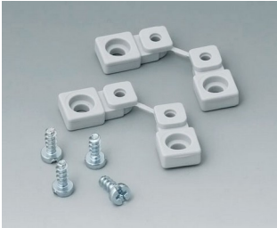
C2299028 Wall mounting brackets PA 6 (UL 94 HB) light grey RAL 7035