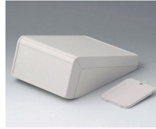
B4056227 UNITEC M, 1.4/0.6 ABS (UL 94 HB) off-white RAL 9002 148x210x80mm IP 40