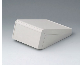
B4054117 UNITEC S, 1.4/1.4 ABS (UL 94 HB) off-white RAL 9002 125x177x69mm IP 40