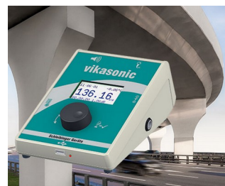
Ultrasonic measuring device