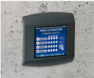
Control panel for home automation

Periferiche di computer e informatica, IoT/IIoT, sistemi di rilevamento dati sul posto di lavoro, impianti di intercomunicazione e di monitoraggio, dispositivi per il controllo dell'accesso, metrologia, tecnica di regolazione, tecnica medica e di laboratorio, ecc.