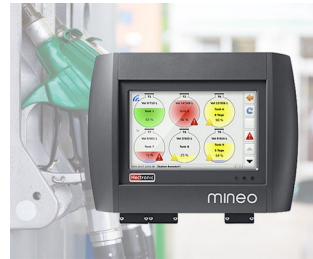
Controller for intelligent tank management