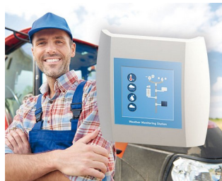
Weather Monitoring Station