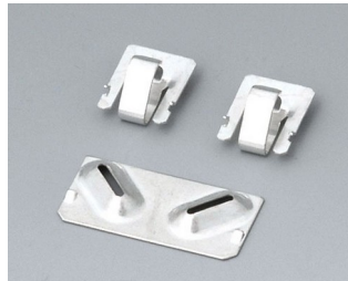
A9190002 Set of battery clips, 2xN/2xAA/2xAAA Steel tin-plated