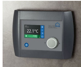
Solar Control Panel