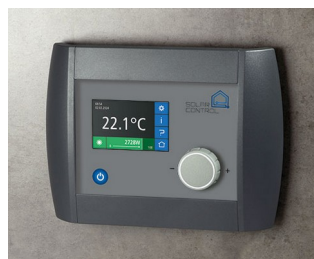
Solar Control Panel