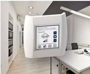
Indoor air quality control