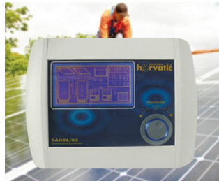
Control unit for photovoltaic solar installations