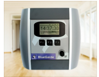
House control unit