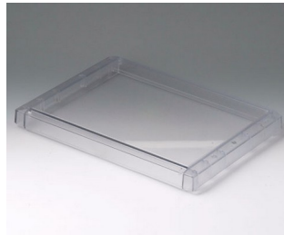
B4030621 Cover L, flat PC (UL 94 V-0) transparent 302x220x29mm