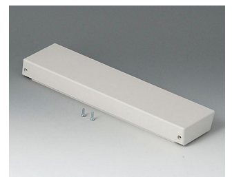
B4030417 Lid L closed, flat ABS (UL 94 HB) off-white RAL 9002 268x62x24mm