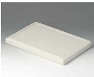
B4026617 Cover SL ABS (UL 94 HB) off-white RAL 9002 264x180x23mm