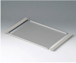
B4130126 Profile plate L Aluminium matt anodised 302x220x8mm