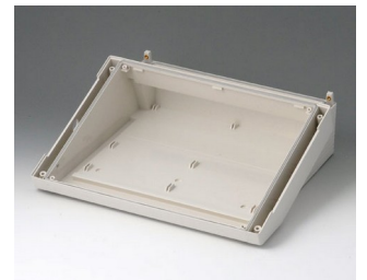
B4030317 DATEC-TERMINAL L, Vers. III ABS (UL 94 HB) off-white RAL 9002 302x272x101mm IP 54 opt.