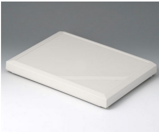
B4030617 Cover L, flat ABS (UL 94 HB) off-white RAL 9002 302x220x29mm