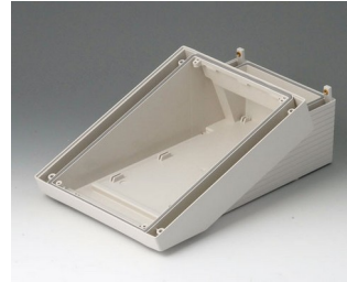
B4016117 DATEC-TERMINAL M, Vers. I ABS (UL 94 HB) off-white RAL 9002 168x272x101mm IP 54 opt.