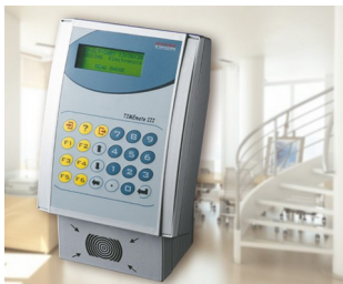
Terminal for time recording, access control and order management