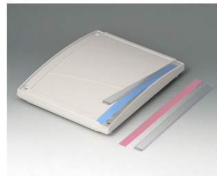
B4016671 Cover strip M / L PC (UL 94 V-0) transparent