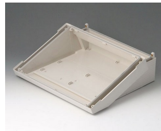
B4030217 DATEC-TERMINAL L, Vers. II ABS (UL 94 HB) off-white RAL 9002 302x272x101mm IP 54 opt.