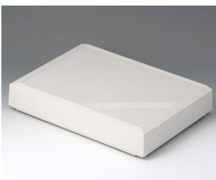
B4030657 Cover L, high ABS (UL 94 HB) off-white RAL 9002 302x220x50mm