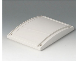
B4013637 Cover S, convex ABS (UL 94 HB) off-white RAL 9002 130x180x28mm