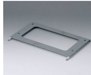
B4126147 Wall suspension element SL Steel galvanized 210x137x8mm