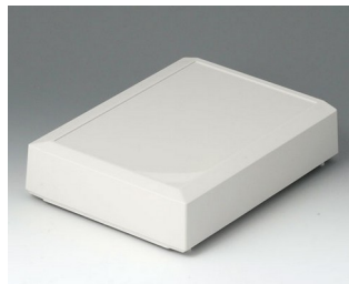
B4016657 Cover M, high ABS (UL 94 HB) off-white RAL 9002 168x220x50mm