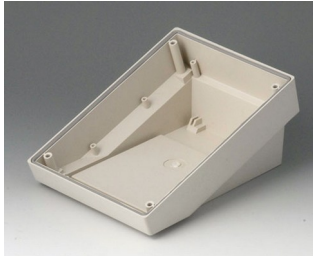
B4013117 DATEC-TERMINAL S ABS (UL 94 HB) off-white RAL 9002 130x180x86mm IP 54 opt.