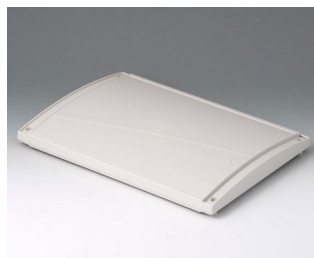
B4030637 Cover L, convex ABS (UL 94 HB) off-white RAL 9002 302x220x29mm