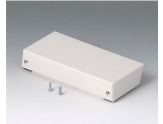
B4016417 Lid M closed, flat ABS (UL 94 HB) off-white RAL 9002 134x62x24mm