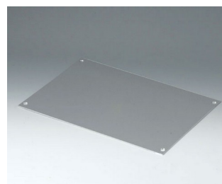
B4130106 Front panel LS Aluminium matt anodised 299,4x217,4x2mm