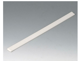
B4016677 Cover strip M / L ABS (UL 94 HB) off-white RAL 9002