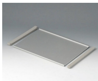
B4126126 Profile plate SL Aluminium matt anodised 263x180x8mm