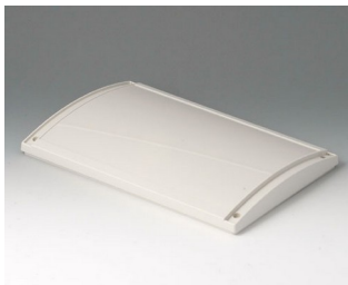
B4026637 Cover SL, convex ABS (UL 94 HB) off-white RAL 9002 263x180x28mm