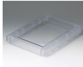
B4016621 Cover M, flat PC (UL 94 V-0) transparent 168x220x29mm