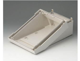
B4016217 DATEC-TERMINAL M, Vers. II ABS (UL 94 HB) off-white RAL 9002 168x272x101mm IP 54 opt.