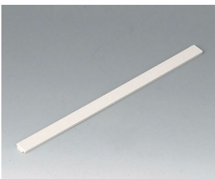
B4113677 Cover strip S / SL ABS (UL 94 HB) off-white RAL 9002