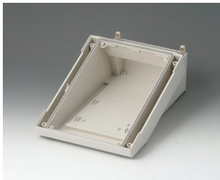
B4016317 DATEC-TERMINAL M, Vers. III ABS (UL 94 HB) off-white RAL 9002 168x272x101mm IP 54 opt.