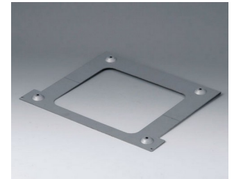
B4130147 Wall suspension element L Steel galvanized 214x260x12mm

Salvo modifiche tecniche. © OKW Gehäusesysteme, Buchen/Germania.