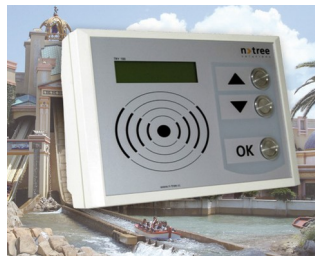
Versatile terminal for leisure facilities