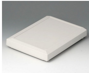
B4016617 Cover M, flat ABS (UL 94 HB) off-white RAL 9002 168x220x29mm