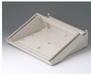
B4030117 DATEC-TERMINAL L, Vers. I ABS (UL 94 HB) off-white RAL 9002 302x272x101mm IP 54 opt.