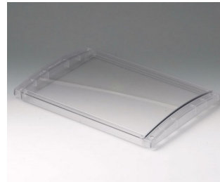
B4030631 Cover L, convex PC (UL 94 V-0) transparent 302x220x29mm