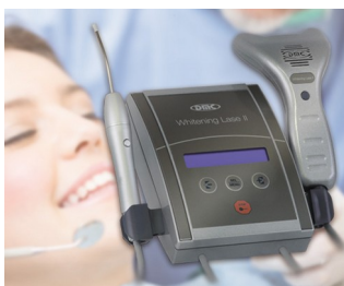
Dental Whitening and laser therapy

Sistemi di rilevamento dei dati sul posto di lavoro e su macchinari, informatica, controlli degli accessi, impianti di intercomunicazione e di monitoraggio, tecnica medica, health care, metrologia, comando, regolazione, tecnica di riscaldamento e di condizionamento dell'aria, ecc.