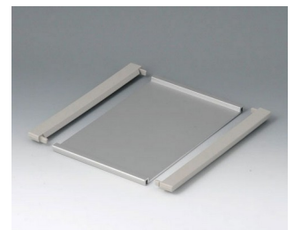
B4116126 Profile plate M Aluminium matt anodised 168x220x8mm