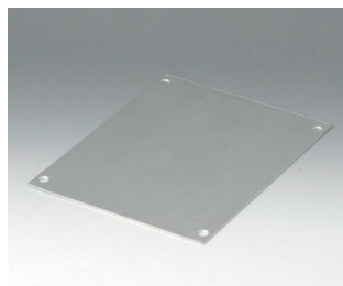
B4116106 Front panel MS Aluminium matt anodised 165,4x217,4x2mm