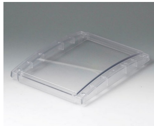
B4016631 Cover M, convex PC (UL 94 V-0) transparent 168x220x29mm