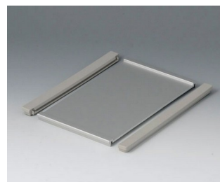
B4113126 Profile plate S Aluminium matt anodised 130x180x8mm