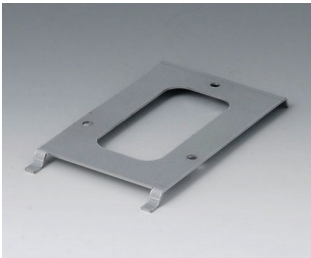
B4113147 Wall suspension element S Steel galvanized 79x137x8mm