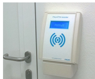
RFID access control readers