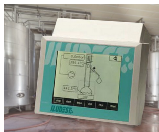
Device for monitoring and controlling distillation units