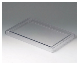
B4026621 Cover SL PC (UL 94 V-0) transparent 264x180x23mm