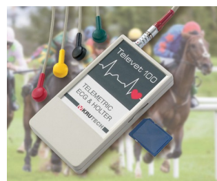
Telemetric ECG system for veterinary medicine