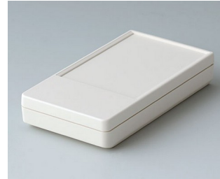
A9070117 DATEC-POCKET-BOX S ABS (UL 94 HB) off-white RAL 9002 85x46x16mm IP 54