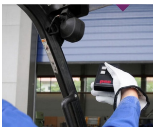
IR remote control for harsh environments