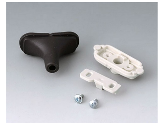
B2911329 Cable gland kit, 5.0 - 5.9 TPE black RAL 9005