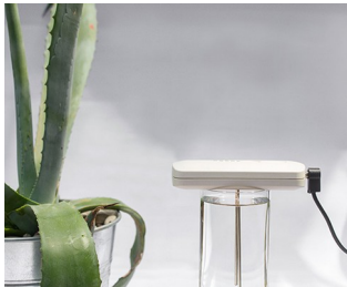
Tool for making colloidal silver solutions