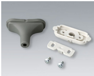
B2911318 Cable gland kit, 4.2 - 5.0 TPE volcano