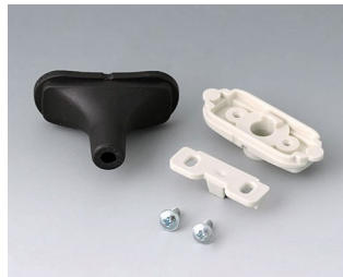
B2911319 Cable gland kit, 4.2 - 5.0 TPE black RAL 9005