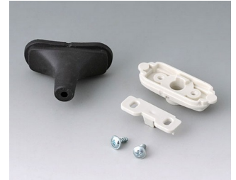
B2911309 Cable gland kit, 3.4 - 4.2 TPE black RAL 9005