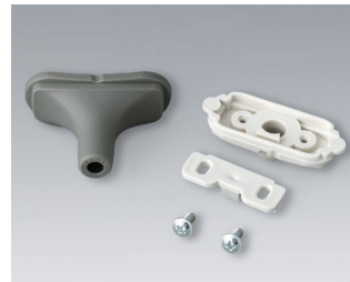
B2911328 Cable gland kit, 5.0 - 5.9 TPE volcano