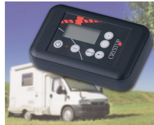
Remote control unit for AutoSat satellite receiver