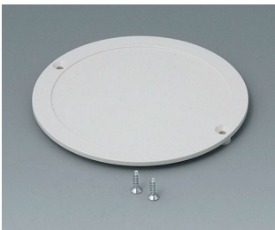
B5011857 Battery compartment lid ABS (UL 94 HB) off-white RAL 9002