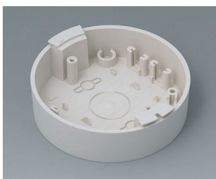
B5011117 Base ABS (UL 94 HB) off-white RAL 9002